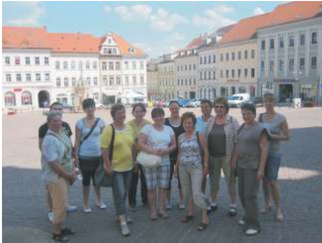
Gruppenfoto am Marktplatz