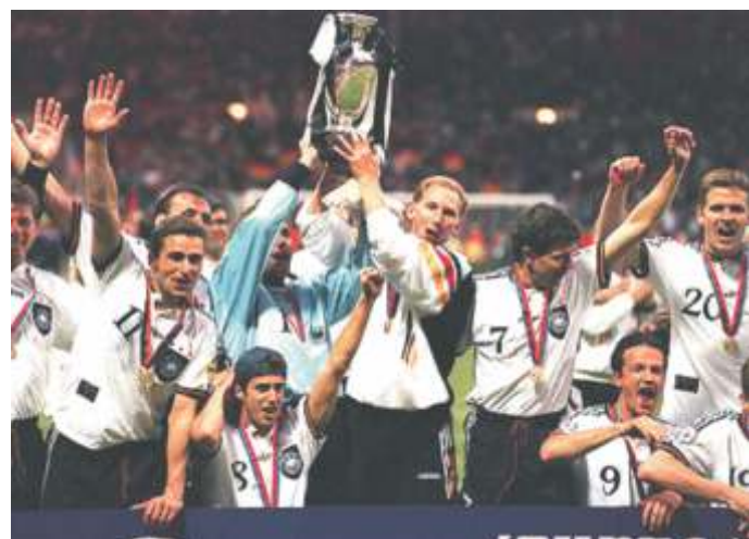
der letzte Titel 1996

Durch die schwierige Gruppenkonstellation ist es auch möglich, dass es in der ersten Turnierphase schon überraschen geben wird. Immerhin sind die Gruppenegegner Holland und Portugal selbst ernannte Favoriten. Der schwere Turnierauftritt kann