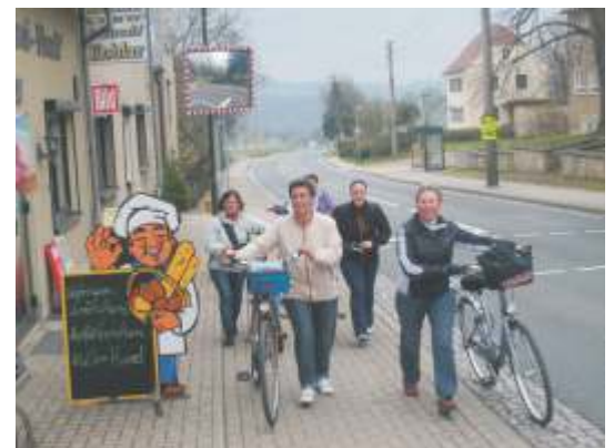
erwischt! Kraft gespart

durch Gleisberg. Der ein oder andere spielte aus Tempogründen mit dem Gedanken, auf die nahegelegene Autobahn aufzufahren.