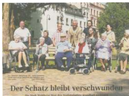
Der Schatz bleibt verschwunden

Den Mietern des Betreuten Wohnens im Staupitzhaus in Waldheim wurde kürzlich eine ganz besondere Freude bereitet. Nach längerer Bauzeit wurde direkt vor der Tür des Betreuten Wohnens in der Härtelstraße in Waldheim der Denkmalplatz neu saniert eröffnet. Die Stadt