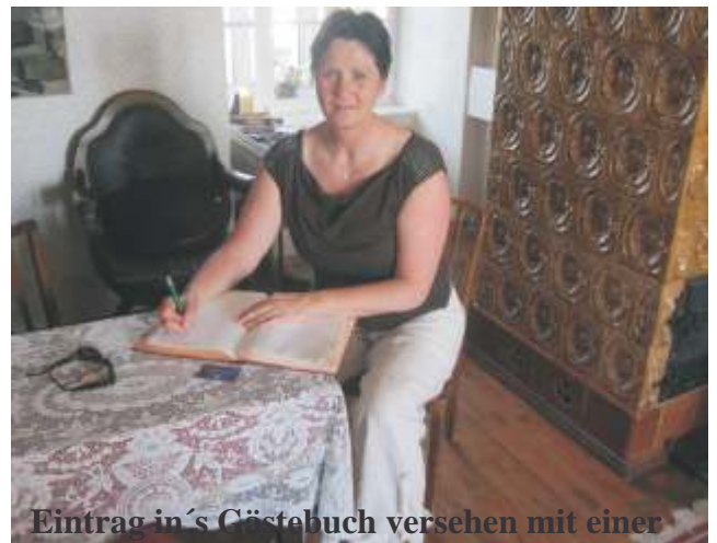
Eintrag in's Gästebuch versehen mit einer Geldspende für die Vereinsarbeit

Im Waagenmuseum wurden wir schon erwartet. Wir bekamen eine Führung durch die Oschatzer Stadtgeschichte und die Umgebung, über die Oschatzer Handelsgeschichte und Fundstücke aus Privatbesitz. Des weiteren gingen wir in den Neubau des Museums an der alten Stadtmauer, wo die vielen „Waagen“ ausgestellt werden, da das Museum gerade 30jähriges Bestehen feiert. Dort wurde uns erzählt, dass es eine über 100 Jahre alte Sitzwaage vorhanden ist, dies war für und Pflegekräfte natürlich interessant. Die Waage wurde bis ins Jahr 2010 jährlich im November in den Ratssaal gebracht, alle Ratsherren wurden unter Beachtung der Privatsphäre gewogen, aus all den Gewichten ein Durchschnittswert ermittelt z.B. 83 kg und diesen Durchschnittswert