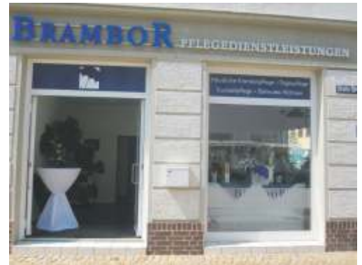
unser neues Domizil

Was lange dauert, wird ewig gut. Unter diesem Motto stand die Eröffnung unserer neuen Geschäftsstelle der Häuslichen Krankenpflege Brambor auf dem Döbelner Niedermarkt. Seit Juli des vergangenen Jahres wurde dieser Standort bereits angemietet. Auf Grund von unzähligen Aufgaben der Bürokratie ging sie mit reichlich Verspätung am 02.05.2012 endlich in Betrieb. Im Zuge dieses weiteren Standortes wurde der Pflegedienst Brambor rein organisatorisch "geteilt". Diese Entscheidung hat verschiedene Gründe. Das vorrangige Ziel ist,