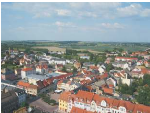
Blick über Oschatz