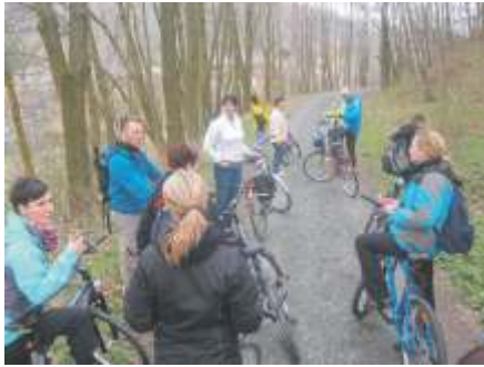
erste Pause an der Herrenaue Hauptstandort "Rüderpark" losgehen.

Der Kompass zeigte in Richtung Gleisberg. Entlang der Freiburger Mulde radelten wir im Pulk von ca. 25 Personen in Richtung Ortsausgang. Durch die "Herrenaue" fuhren wir vorbei am Kloster Altzella in Richtung Rhäsa. Das eigentlich Ziel unserer Radtouren in dieser Jahreszeit heißt "Eis Gräfe Eula". Einziges Problem: Mittwoch ist Ruhetag. Also fuhren wir mit gleichem Vorsatz (eis schlemmen) in Richtung des Heimatdorfes von C.B. - Rhäsa.