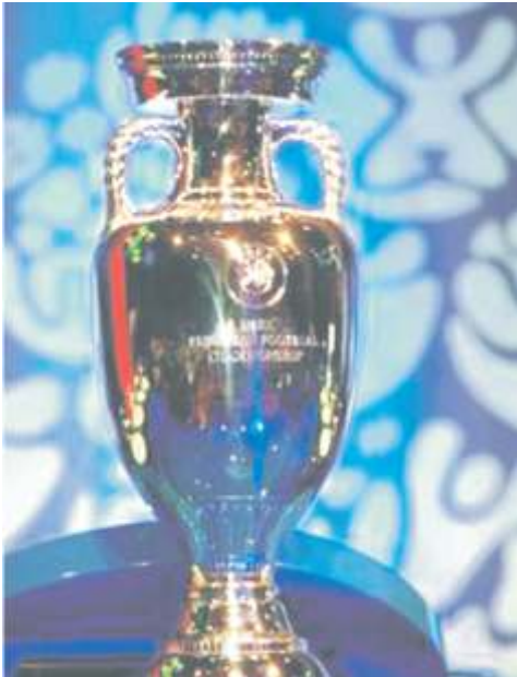
das Objekt der Begierde

Die Erwartungen ganz vor mitzuspielen gibt es auch im Tulpenstaat Niederlande. Zu fast jedem Turnier haben die Holländer eine Mannschaft am Start, die vom Papier her in der Lage ist, jede Mannschaft zu schlagen. Oft scheiterten die "Oranjes" durch Pech oder eigenes Unvermögen. Diesmal gehört Holland allerdings wieder zum Favoritenkreis und wird versuchen nach dem Pokal zu greifen.