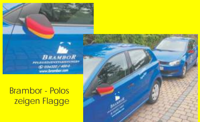
Brambor - Polos zeigen Flagge

Auch wir sind Deutschland! Wir zeigen Flagge! Natürlich fiebert auch unsere Firma mit der deutschen Mannschaft mit und freut sich auf die bevorstehende Europameisterschaft. Um dies auch nach außen öffentlich zu bekunden, zeigen wir Flagge und haben alle Firmenfahrzeuge der "blauen Flotte" an den Außenspiegeln mit Deutschland - Fahnen überzogen!