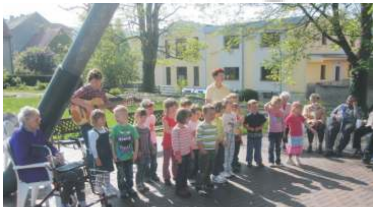
wunderbare Atmosphäre unter unserem Schirm im Park

"Schirm" im Programm des Im Anschluss daran Gäste der Tagespflege und Bewohner der Kurzzeitpflege bekannte Frühlingslieder.