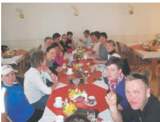
gemütliche Runde im Cafe

durch Rhäsa ging es am Tanklager vorbei in Richtung