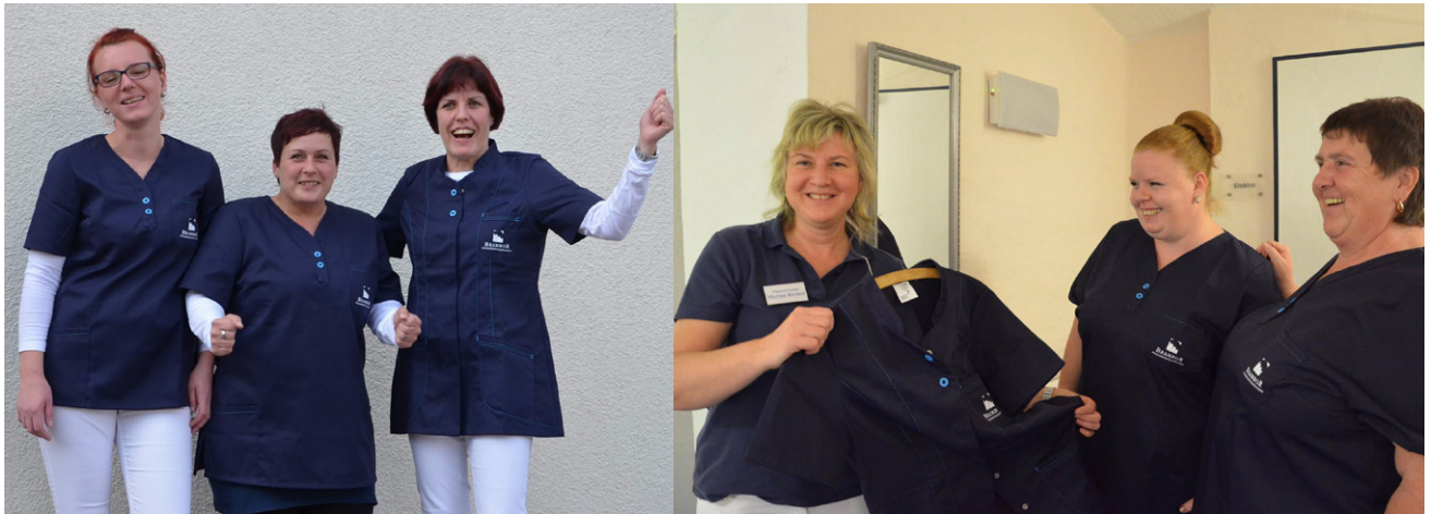
1. und 2. Foto: Die neue Dienstkleidung kommt bei den Mitarbeiterinnen von Brambor sehr gut an. 3. Foto: Unsere Klienten und deren Angehörigen finden die neue Dienstbekleidung ebenfalls perfekt gelungen. 4. Foto: Anprobe mit dem Team von „Konfektion in Perfektion“

Sehen unsere Pflegefachkräfte nicht schick aus?