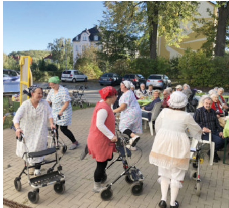
Buntes Programm zum Abschlussfest aus einem lustigen Theaterstück, einem grandiosen Mitarbeiter-Rollatoranz, Glücksrad u.v.m.