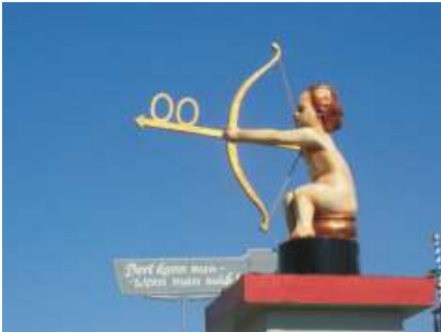
Wegweiser zu den Toiletten