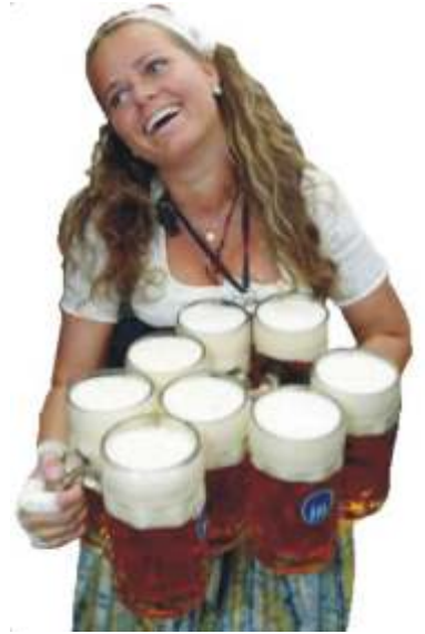
eine von knapp 2000 Kellnerinnen

Wir würden uns sehr freuen, wenn Sie uns neben Vorschlägen für weitere Titelthemen auch ab und an Ihre Meinung zu vorangegangenen Themen mitteilen würden.