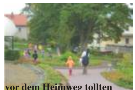
vor dem Heimweg tollten die Kinder im Park

Schließlich bedankten sich alle Gäste der Tagespflege mit einem Blumengruß bei Frau Hoppe und Ihren Schützlingen für den abermals gelungenen und abwechslungsreichen Vormittag.