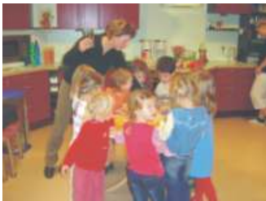
hier gab´s Getränke und Süßigkeiten