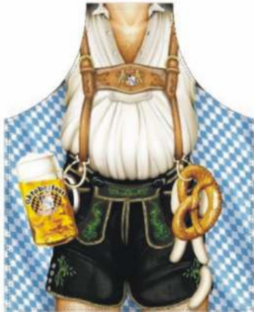
typisch: Lederhose, Maß, Brezel

dieses Vorhaben auf Grund von geschichtlichen Ereignissen, die im folgenden genannt sind, gestört.