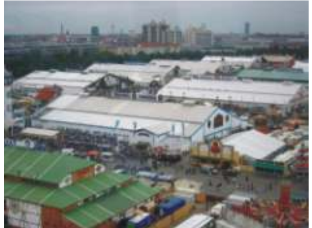
Blick vom Riesenrad auf ca. 30 Festzelte