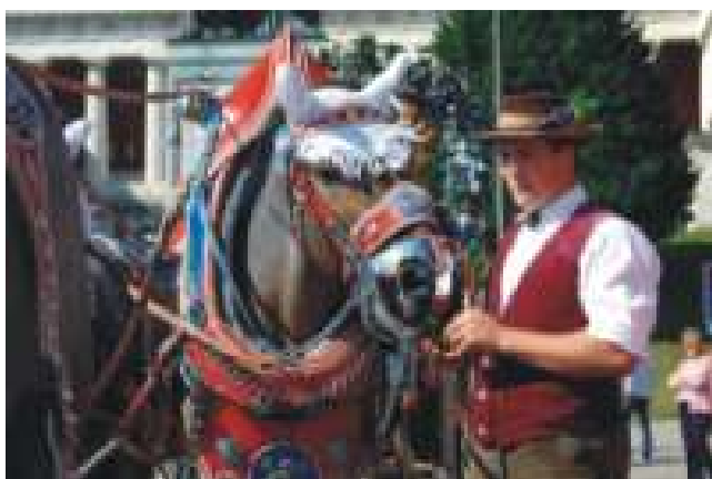
Pferdekutscher in typischer Tracht

Ein tragisches Datum in der Geschichte der Wiesn ist der 26. September 1980. Am Haupteingang des Festgeländes explodierte eine Bombe. Dreizehn