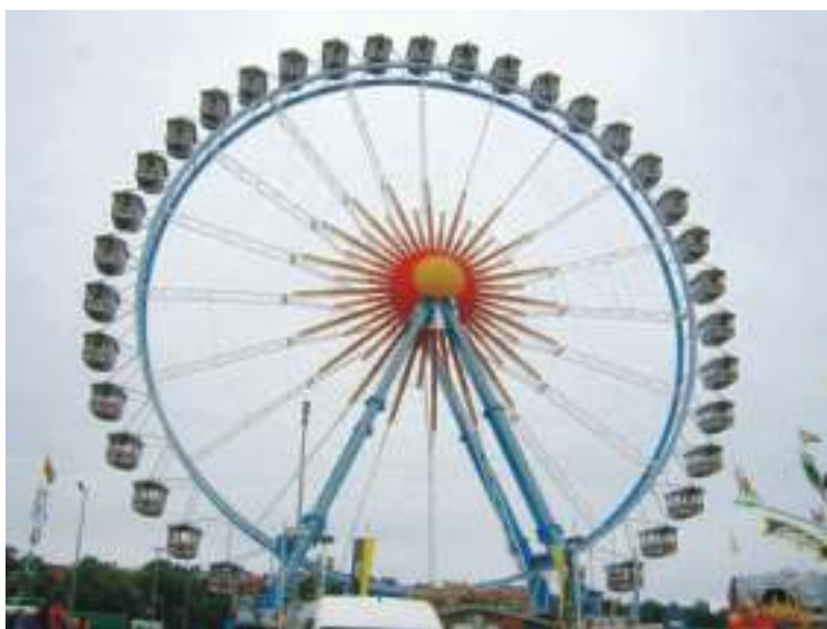
das bekannte Münchner Riesenrad

Die Münchner Verkehrsgesellschaft befördert nach eigenen Angaben knapp vier