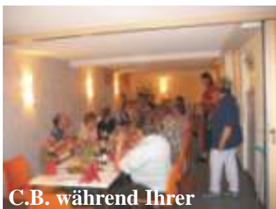
C.B. während Ihrer Ausführungen

Wenn Sie auch Anekdoten aus vergangenen Jahren zu berichten wissen, schreiben Sie uns. Für dazugehöriges Bildmaterial (dieses bekommen Sie unversehrt zurück), sind wir dankbar.