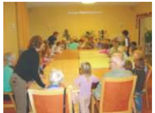
lustige Runde strickt Spinnennetz

Dabei wickelte sich jeder, der die Rolle im Moment hatte, ein Stück dieses Strickes um den Finger und rollte den restlichen Knäul zum nächsten Teilnehmer. Diese Methode hatte zur Folge, das am Ende des Spiels ein Spinnennetzähnliches Muster auf den Tischen entstand. Die Kinder und Tagespflegegäste lernten sich dabei deshalb besser kennen, weil jeder der die Wolle zugespült bekam, seinen Namen und seinen Wohnort nennen sollte. Diese Art der Vorstellung